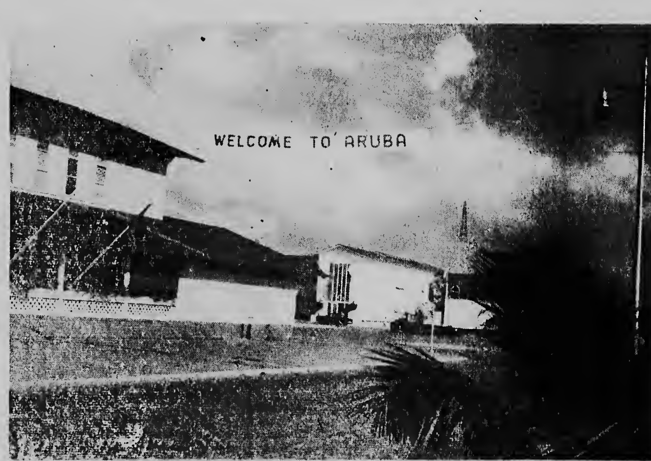
„Welcome to Aruba” staat op grote spandoeken, die thans overal in Oranjestad worden aangebracht ter gelegenheid van de komst van de „Tradewind”.